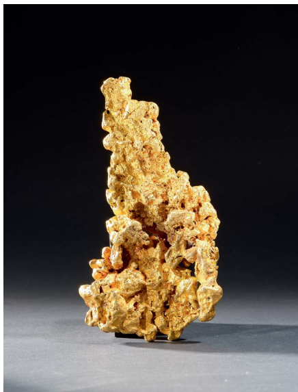
935 PÉPITE D'OR Victoria, Australie 1647 g 16,8 × 8,8 cm CHF 120 000 / 150 000