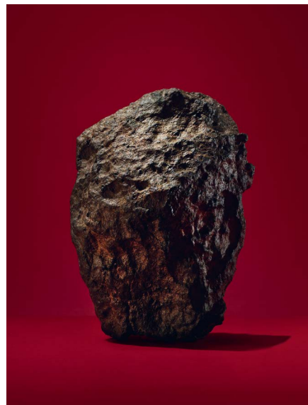
942 LE COLOSSE ROUGE MÉTÉORITE MARTIENNE Nom officiel de la météorite : Swayyah 005 2145 g, 16,6 × 11,5 × 9,3 cm CHF 150 000 / 250 000