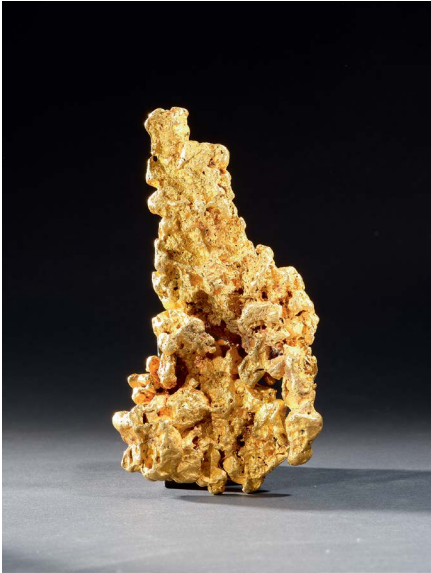
935 GOLDNUGGET Victoria, Australien 1647 g 16,8 × 8,8 cm CHF 120 000 / 150 000