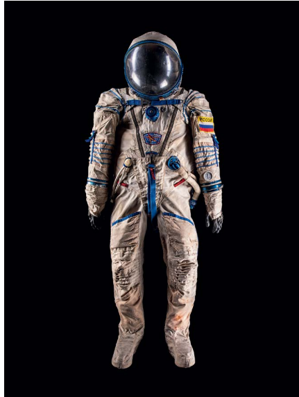
911 SOKOL-KV2 RAUMFAHRTANZUG Hergestellt von NPP Zvezda 1985 165 × 70 × 40 cm CHF 65 000 / 85 000