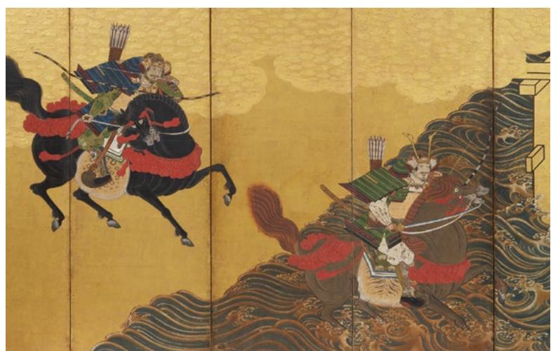
376 PAAR PRÄCHTIGE STELLSCHIRME DER HASEGAWA-SCHULE Japan, frühes 17. Jh. Tusche, Farben und Gold sowie Blattgold auf Papier. Je 169,7 × 376 cm. CHF 80 000 / 120 000 Verkauft für CHF 150 000