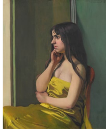
3041 FÉLIX VALLOTTON Torse à l'étoffe jaune. 1913. Öl auf Leinwand. 81 × 65,5 cm CHF 100 000 / 150 000 Verkauft für CHF 225 000