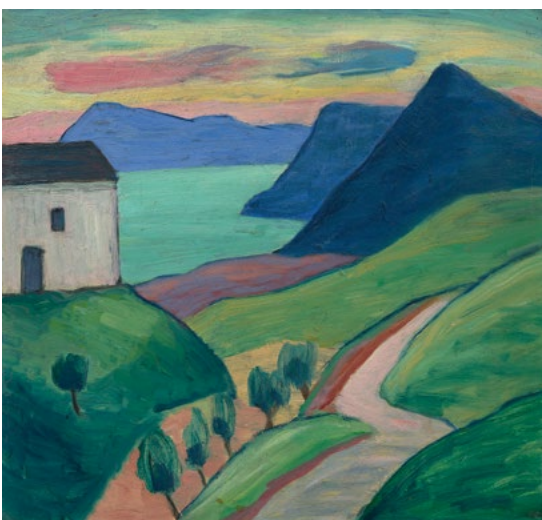
3247 GABRIELE MÜNTER Haus am See mit blauen Bergen. 1933–35. Öl auf Karton. 38 × 40 cm. CHF 200 000 / 300 000 Verkauft für CHF 250 000

Das Spitzenlos der Auktion Asiatica am 18. Juni war ein Werk des begehrten chinesischen Künstlers Lin Fengmian , das mit CHF 375 000 deutlich über der Schätzung verkauft wurde (Los 251, Schätzung CHF 180 000 / 250 000). Obwohl der Besitzer traurig war, dass das Gemälde seine Sammlung verlassen musste, kann er sich über das Ergebnis nicht beklagen: Er hatte das Werk vor Jahren auf einem Flohmarkt gesehen, und obwohl er nichts über den Künstler wusste, verliebte er sich in das Werk und kaufte es ... für CHF 400. Ein Paar Stellschirme der Hasegawa-Schule wurde vom renommierten Museum Rietberg in Zürich für CHF 150 000 ersteigert (Los 376, Schätzung CHF 80 000 / 120 000).