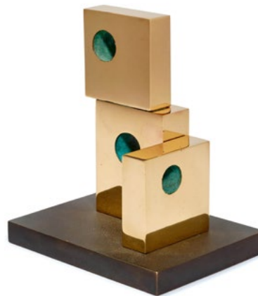
3292 BARBARA HEPWORTH Three forms (Extra eye). 1969. Polierte Bronze. H 20 cm. CHF 60 000 / 80 000 Verkauft für CHF 168 000