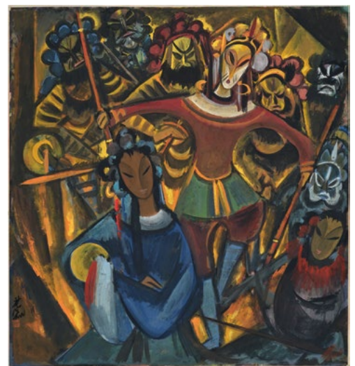
251 LIN FENGMIAN Der Affenkönig Sun Wukong und sein Operngesolge im Stück «Tumult im Himmel». Tusche und Farben auf Papier. 69 × 65 cm. CHF 180 000 / 250 000 Verkauft für CHF 375 000