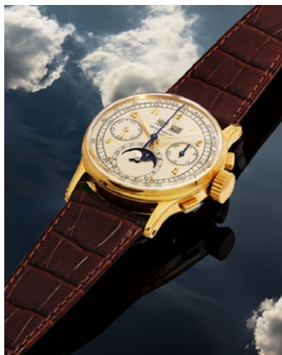
2885 PATEK PHILIPPE Ewiger Kalender mit Chronograph Ref. 1518, hergestellt 1950. Gelbgold 750. CHF 180 000 / 360 000 Verkauft für CHF 500 000