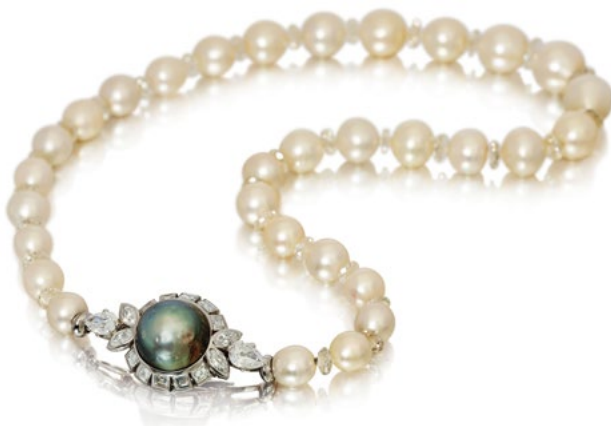
2314 NATURPERLEN-DIAMANT-COLLIER, WOHL CARTIER London, um 1920. CHF 70 000 / 100 000 Verkauft für CHF 400 000

Die Schmuckauktion am 19. Juni war wieder einmal sehr erfolgreich, mit Zuschlagspreisen, die 97% den Schätzungen erreichten , darunter ein wunderschönes Collier aus Naturperlen und Diamanten, das Cartier zugeschrieben wird und CHF 400 000 gegenüber einer Schätzung von CHF 70 000 / 100 000 erzielte (Los 2314). Bei der Uhrenauktion am 17. Juni wechselte eine frühe Uhr mit ewigem Kalender von Patek Philippe für CHF 500 000 den Besitzer (Los 2885, CHF 180 000 / 360 000).