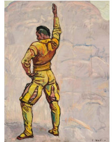
3047 FERDINAND HODLER Einmütigkeit, Schwörender. 1913. Öl auf Leinwand. 88 × 64,5 cm. CHF 100 000 / 150 000 Verkauft für CHF 237 000