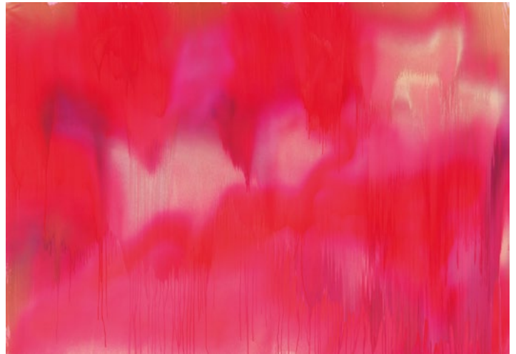
3451 KATHARINA GROSSE Ohne Titel. 2000. Acryl auf Leinwand. 200 × 284 cm. CHF 180 000 / 250 000 Verkauft für CHF 225 000

In der Auktion Impressionismus und Moderne Kunst am 21. Juni waren Werke von Künstlerinnen des frühen 20. Jahrhunderts gefragt, wie eine herbstliche Landschaft mit Reitern von Marianne von Werefkin , die für CHF 475 000 (Auktionsweltrekord) verkauft wurde (Los 3235, Schätzung CHF 100 000 / 150 000), und Gabriele Münters «Haus am See mit blauen Bergen» von 1933–35, das für CHF 250 000 den Besitzer wechselte (Los 3247, Schätzung CHF 120 000 / 200 000).