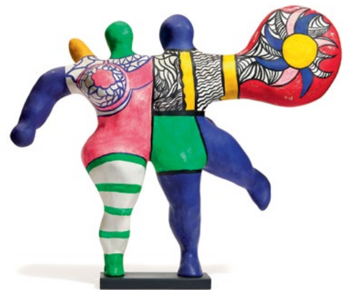
3447 NIKI DE SAINT PHALLE Les patineurs (couple ailé). Kunstharz, bemalt. Unikat. 49 × 65 cm. CHF 25 000 / 35 000 Verkauft für CHF 107 000