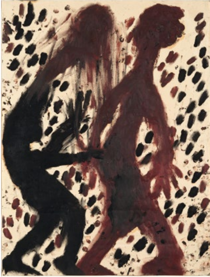
3081 LOUIS SOUTTER Lutte avec le Démon. 1938–1939. Mischtechnik auf Papier (Fingermalerei). 57,5 × 44 cm. CHF 200 000 / 300 000 Verkauft für CHF 287 000