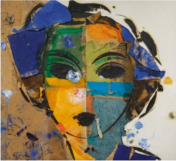
3443 MANOLO VALDÉS Dorothy IX. 2003. Öl, Papier, Teer und Jute mit Garn und Heftklammern collagiert, auf Jute. 180 × 300 cm. CHF 180 000 / 300 000 Verkauft für CHF 350 000