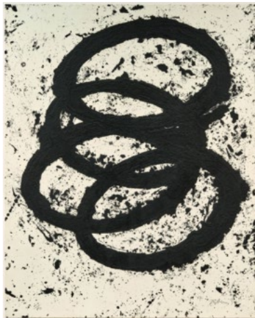
3696 RICHARD SERRA T.E. Siegen. 1999. Radierung. 29/40. 151,1 × 121 cm. CHF 18 000 / 28 000 Verkauft für CHF 67 000