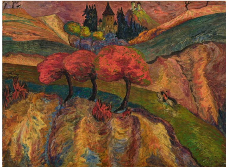
3235 MARIANNE VON WEREFKIN Romantische Landschaft mit Reitern. Um 1915. Öl und Tempera auf Holz. 56,5 × 74,4 cm. CHF 100 000 / 150 000 Verkauft für CHF 475 000 (Auktionsweltrekord)

über der oberen Schätzung für CHF 237 000 verkauft (Los 3047, Schätzung CHF 100 000 / 150 000). Weitere Werke von Amiet erzielten ebenfalls gute Preise, wie z.B. CHF 168 000 für eine stimmungsvolle Ansicht des Stockhorns (Los 3046, Schätzung CHF 60 000 / 80 000), ebenso wie Gemälde von Félix Vallotton , z.B. ein Frauenporträt mit dem Titel «Torse à l'étoffe jaune», 1913, das für CHF 225 000 verkauft wurde (Los 3041, Schätzung CHF 100 000 / 150 000).