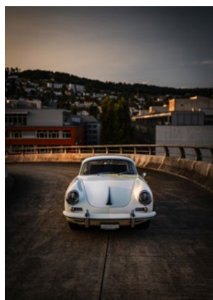
LOT 831 — PORSCHE 356SC PEINTE PAR ALFREDO HÄBERLI Projet «Gewicht der Leichtigkeit». 356 SC 1600 Karmann Coupé, 1964. ESTIMATION : CHF 95 000 / 180 000