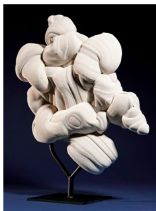
LOT 894 — GOGOTTE «PROMETHEUS» Fontainebleau, France 61 × 49 × 19 cm (support non compris). ESTIMATION : CHF 8 000 / 12 000