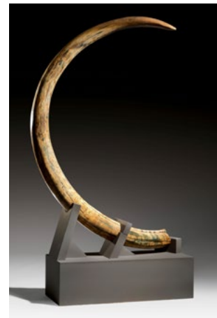
LOT 823 — DENT DE MAMMOUTH LAINEUX