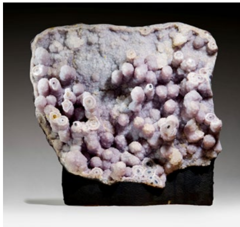
LOT 863 — GÉODE D'AMÉTHYSTE STALACTITE