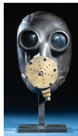
LOT 837 — MASQUE DE PLONGÉE USA, 1940. 22 × 14 × 15 cm (support non compris) ESTIMATION : CHF 3 500 / 5 000