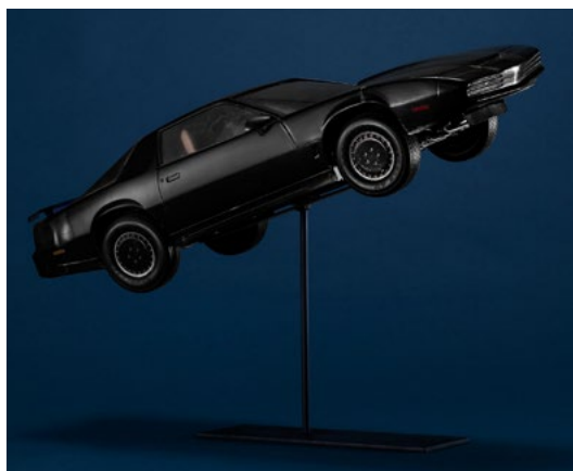
LOT 812 — MINIATURE K.I.T.T. CAR DE «KNIGHT RIDER»