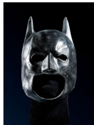
LOT 902 — MASQUE D'ESSAI ORIGINAL DE BATMAN