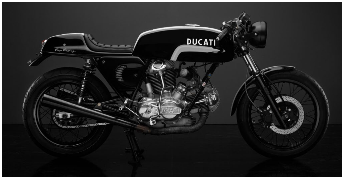
LOT 886 — DUCATI 750S Designer: Yves Lingme. ESTIMATION : CHF 40 000 / 60 000