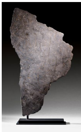
LOT 855 — TRANCHE DE LA MÉTÉORITE ALETAI

L'une des catégories les plus populaires des ventes «Out of This World» est celle des souvenirs de l'industrie du divertissement. Cette vente comprend une miniature de la voiture K.I.T.T. de la série télévisée «Knight Rider» (lot 812, CHF 12 000 / 15 000 ) et un masque de test original de Batman du film «The Dark Knight» de 2008 (lot 902, CHF 2 000 / 4 000 )