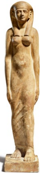
1804 FIGURE D'UNE FEMME DEBOUT PROBABLEMENT UNE REINE Égypte, fin époque Ptolémaïque, 2 e -1 er s. avant J.C. H 59 cm. Résultat : CHF 143 750