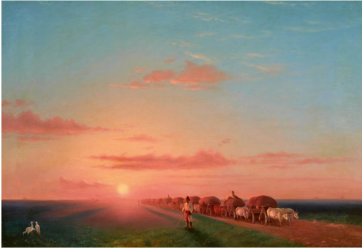
3215 IVAN KONSTANTINOVICH AIVAZOVSKY Paysage étendu avec chars à boeufs, 1858 Huile sur toile, 98,3 × 146,3 cm. CHF 200 000 / 300 000