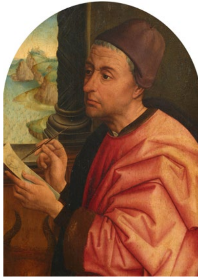
1848 ROGIER VAN DER WEYDEN, ATELIER DE Saint Luc esquisant la Madone Huile sur panneau, 40,3 × 30,3 cm. Résultat : CHF 300 000