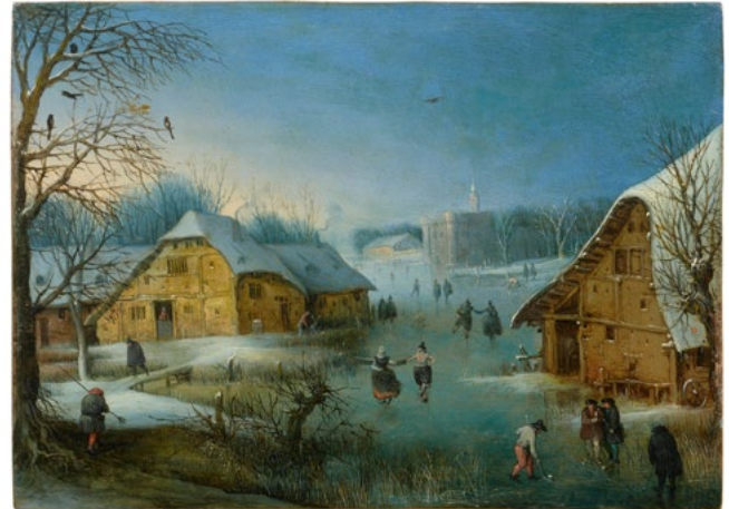
3027 ADRIAEN VAN STALBEMT Paysage hivernal avec patineurs, vers 1610–20 Huile sur cuivre, 10,1 × 13,5 cm Résultat : CHF 75 000