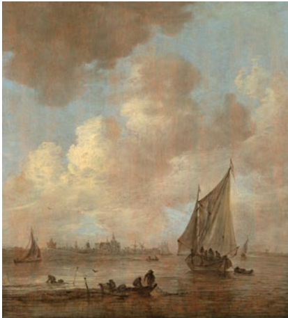
3040 JAN VAN GOYEN Paysage de mer avec bateaux de pêche, 1655 Huile sur panneau, 37,5 × 34,5 cm Résultat : CHF 75 000