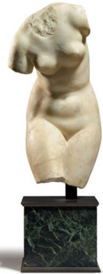
1864 TORSE DE L'APHRODITE ENLEVANT SON SANDALE Hellénistique tardif / romain, 2 e s. avant J.C.–1 er s. après J.C. H hors socle 34 cm. Résultat : CHF 93 750