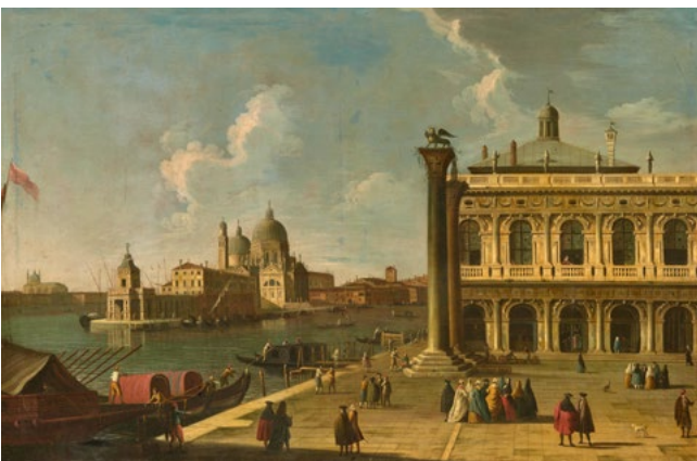
3068 APOLLONIO DOMENICHINI, CERCLE DE Vue de Venise avec la bibliothèque et Santa Maria della Salute Huile sur toile, 91,5 × 148,5 cm Résultat : CHF 62 500