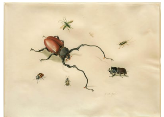
3424 ANTONY HENSTENBURGH Zeven uitheemse Insecten. Aquarelle, gouache sur vélin, 30 × 41 cm Résultat : CHF 28 750