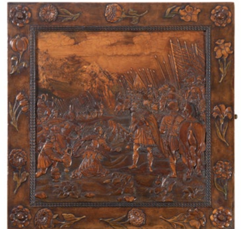
1128 BOÎTE À JEUX POUR ÉCHECS ET TRIC-TRAC AVEC DÉCOR EN RELIEF ET EN MARQUETERIE Ville libre impériale d'Eger (aujourd'hui en Tchéquie), milieu 17 e s. 52,5 × 52,5 cm Résultat : CHF 37 500