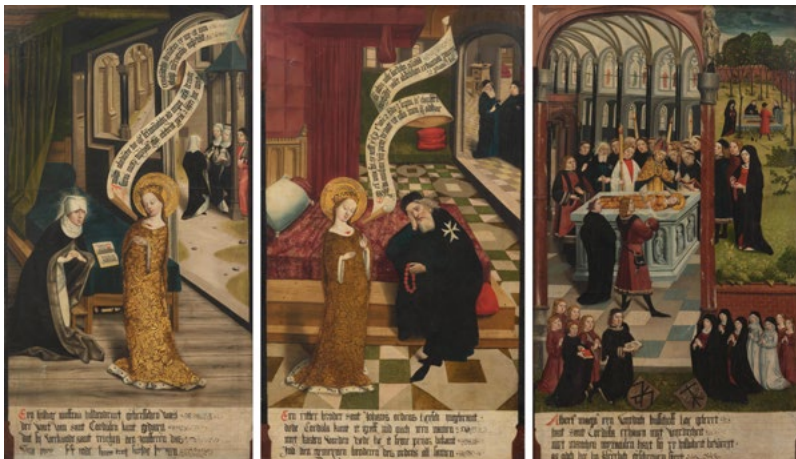
3013 ÉCOLE DE COLOGNE, VERS 1490–1500 Trois scènes de la vie de Sainte Cordule Huile sur toile 141,8 × 81 cm / 138 × 82,5 cm / 140,5 × 76,6 cm Résultat : CHF 66 250