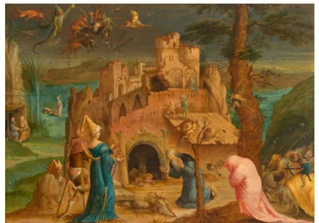
3015 ANVERS, VERS 1600 La Tentation de Saint Antoine Huile sur panneau, 36,5 × 51,3 cm. Résultat : CHF 102 500