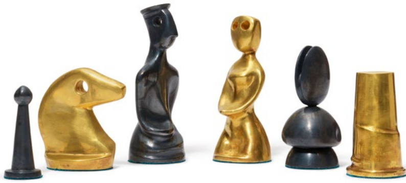
1157 JEU D'ÉCHECS DE MAX ERNST Design 1966, fabriqué par l'orfèvre François Hugo en 1973 Signé, poinçonné et numéroté 4/6. Or 23 carats et argent 990 Résultat : CHF 118 750