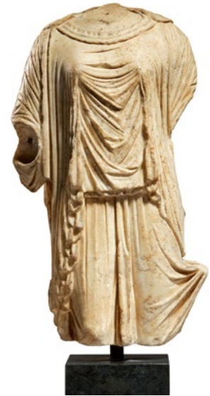
1858 FRAGMENT D'UNE FIGURE FÉMININE DRAPÉE Probablement Chypre, 2 e -1 er s. avant J.C. H hors socle 37 cm. Résultat : CHF 225 000

Une autre collection très demandée était un ensemble d'échiquiers et de pièces de jeu d'échecs , allant d'exemples du 17 ème siècle comme un plateau de jeu d'Eger sculpté et marqueté, qui a rapporté CHF 37 500 (lot 1128, estimation CHF 10 000 / 15 000), à un jeu d'échecs en or et argent massif conçu par Max Ernst , qui a été vendu CHF 118 750 , au-dessus de l'estimation supérieure (lot 1157, estimation CHF 60 000 / 100 000).