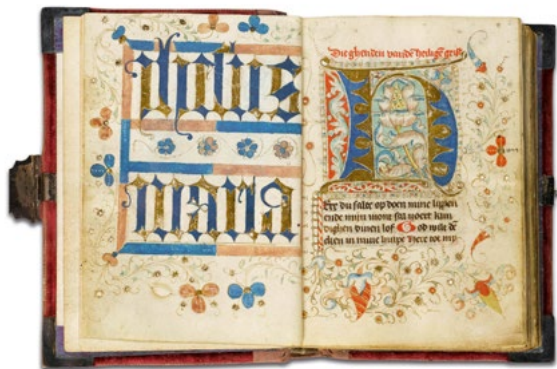
1827 BREVEIAIRE Livre de prières, manuscrit en allemand sur vélin Cologne, vers 1420–1430 Résultat : CHF 42 500