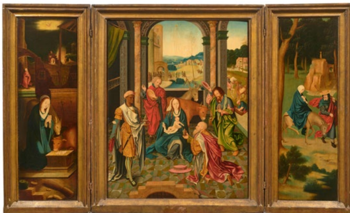
3012 MANIÉRISTE ANVERSOIS, VERS 1515–20 Triptyque avec l'Adoration des Rois Huile sur panneau, panneau central : 84,5 × 68,3 cm / volets : 86 × 28,5 cm chacun Résultat : CHF 106 250

Les autres points forts étaient une « Vue de Venise avec San Giorgio Maggiore » grand format d' Ivan Konstantinovich Aivazovsky , qui a été vendue pour CHF 1 million (lot 3230, estimation CHF 1 / 1,5 million), et une deuxième œuvre d'Aivazovsky représentant sa Crimée natale, qui a atteint CHF 250 000 (lot 3215, estimation CHF 200 000 / 300 000). Un paysage de Jean-Baptiste Camille Corot , « Souvenir d'Italie », a changé de mains pour CHF 75 000 (lot 3212, estimation CHF 80 000 / 100 000). Un triptyque d'un maniériste de l'école d'Anvers représentant l'adoration des rois s'est vendu pour CHF 106 250 (lot 3012, estimation CHF 90 000 / 120 000), et une autre peinture de l'école d'Anvers représentant la tentation de Saint Antoine vers 1600 a doublé son estimation pour atteindre CHF 102 500 (lot 3015, estimation CHF 40 000 / 60 000).