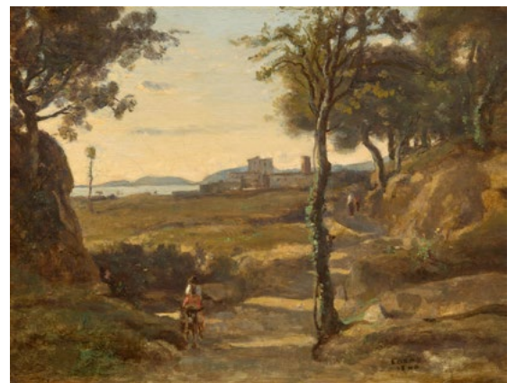
3212 JEAN-BAPTISTE CAMILLE COROT Souvenir d'Italie. Plaines vallonnées avec un village lointain, 1840 Huile sur toile, 24,5 × 32,5 cm Résultat : CHF 75 000