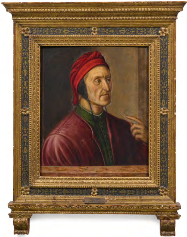
3011 JACOPO CARUCCI DIT PONTORMO, SUIVEUR DU 16 e SIÈCLE Dante Alighieri, uile sur panneau, 59,7 × 47,7 cm Résultat : CHF 59 000