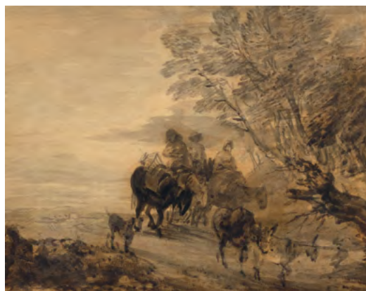
3469 THOMAS GAINSBOROUGH Paysans rentrant du marché. Plume et lavis en gris et brun, crayon noir, 19,5 × 24,6 cm Résultat : CHF 85 000