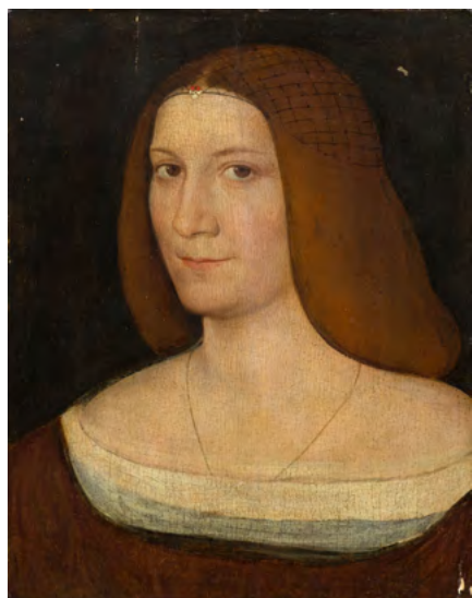
3019 MAÎTRE DE L'ITALIE DU NORD, VERS 1515–20 Portrait d'une dame Huile sur panneau, 25,7 × 20 cm Résultat : CHF 78 000