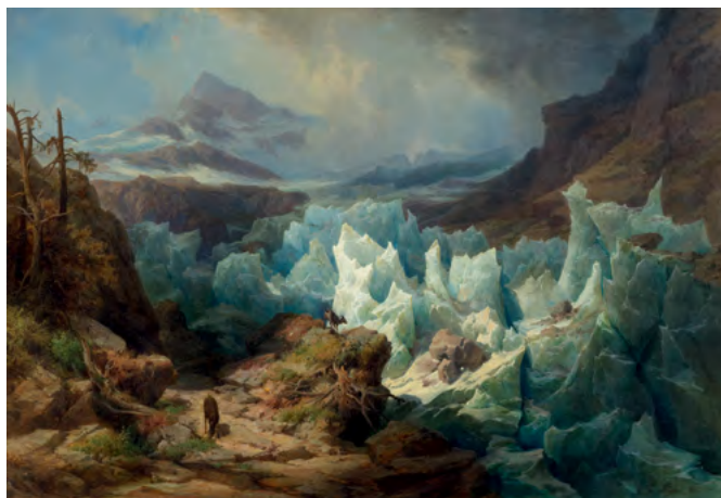
3207 EDUARD FRIEDRICH PAPE Chamois sur le glacier de Grindelwald, 1848 Huile sur toile, 89 × 128 cm Résultat : CHF 33 000