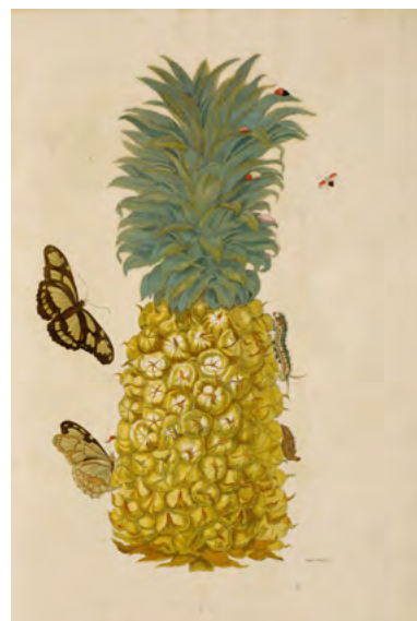
420 MARIA SYBILLA MERIAN Dissertatio de generatione et metamorphosis insectorum Surinamensium La Haye, P. Gosse, 1726 Résultat : CHF 110 000