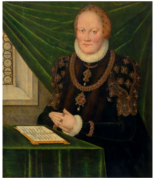
3017 LUCAS CRANACH l'Ancien et atelier Portrait d'Anna de Danemark (1532–1585), Électrice de Saxe Huile sur panneau, 57,7 × 49,1 cm Résultat : CHF 66 000