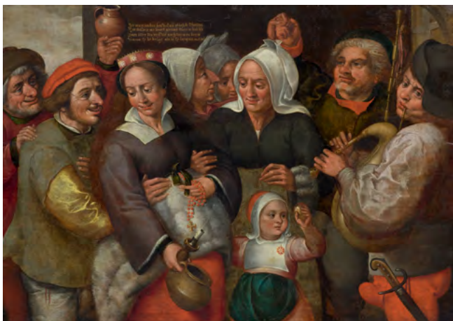
3018 MARTEN VAN CLEVE l'Ancien Avant la nuit de nocces Huile sur panneau, 76 × 106 cm Résultat : CHF 43 000