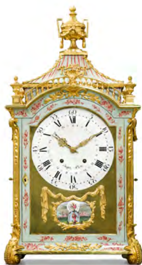
1233 SOGENANNT EFFINGER-PENDULE MIT ORGELWERK UND DATUM Louis XVI, Neuenburg, La Chaux-de-Fonds. Signiert von Pierre Jaquet-Droz. 46 × 32 × 89 cm. Ergebnis: CHF 266 000