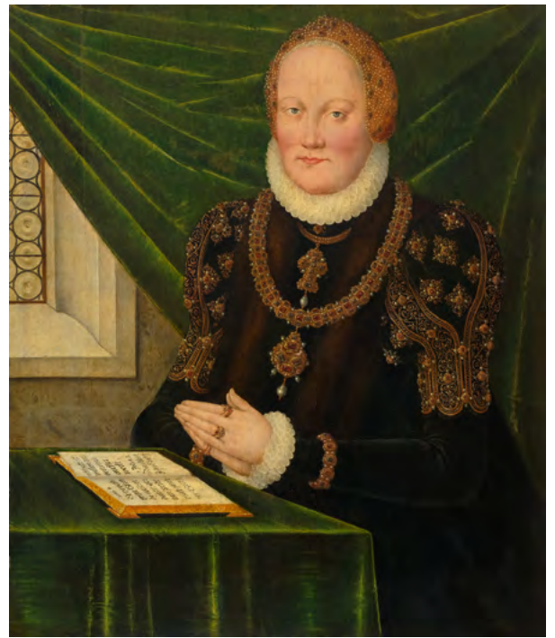
3017 LUCAS CRANACH d. J. und Werkstatt Bildnis Anna von Dänemark (1532–1585), Kurfürstin von Sachsen. Öl auf Holz. 57,7 × 49,1 cm. Ergebnis: CHF 66 000