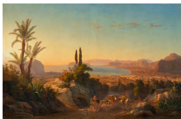
3238 CARL WILHELM GÖTZLOFF Blick auf den Golf von Palermo und das Kap Zafferano mit Reisenden. Öl auf Leinwand. 85,5 × 133 cm. Ergebnis: CHF 32 000