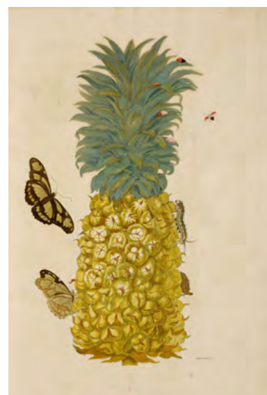
420 MARIA SYBILLA MERIAN Dissertatio de generatione et metamorphosis insectorum Surinamensium. Den Haag, P. Gosse, 1726. Ergebnis: CHF 110 000