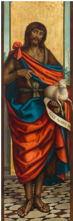
3010 DEFENDENTE FERRARI Der Heilige Johannes der Täufer. Tempera auf Holz 131 × 43,7 cm. Ergebnis: CHF 73 000