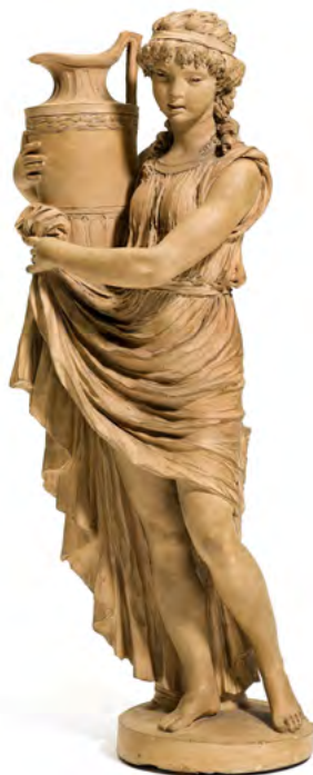
1245 CLAUDE MICHEL CLODION Figur einer jungen Frau mit Amphore. Terrakotta. H 44 cm. Ergebnis: CHF 134 000