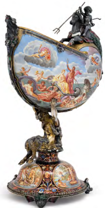
1326 WIENER EMAIL-PRUNKPOKAL IN MUSCHELFORM Wien, nach 1872. Meistermarke Simon Grünwald. H 26 cm. Ergebnis: CHF 18 000