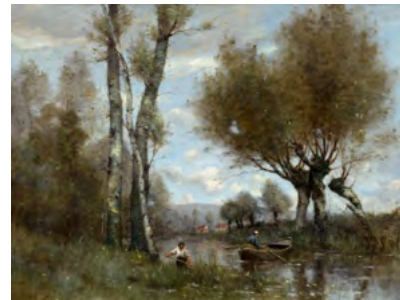
3236 PAUL DÉSIRÉ TROUILLEBERT Le faucheur et un rameur sur la rivière. Öl auf Leinwand. 85 × 113,5 cm. Verkauft für CHF 67 000