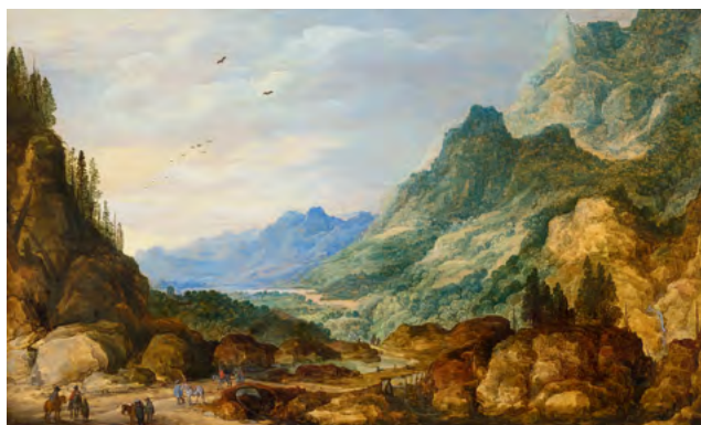
3026 JOOS DE MOMPER D. J. UND JAN BRUEGHEL D. Ä. Weite Berglandschaft mit Reisenden. Öl auf Holz. 46,5 × 75,5 cm. Verkauft für CHF 146 000