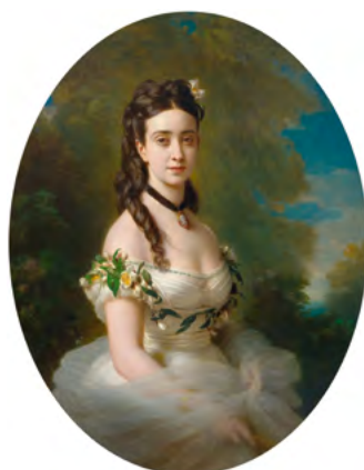
3220 FRANZ XAVER WINTERHALTER Die schöne Amerikanerin. Um 1868–1869. Öl auf Leinwand. 115 × 88 cm. Verkauft für CHF 140 000