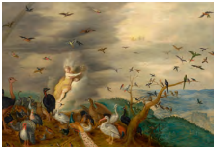
3034 JAN BRUEGHEL D. J. UND AMBROSIUS FRANCKEN D. J. Allegorie der Luft. Öl auf Holz. 42,7 × 61,5 cm. Verkauft für CHF 73 000