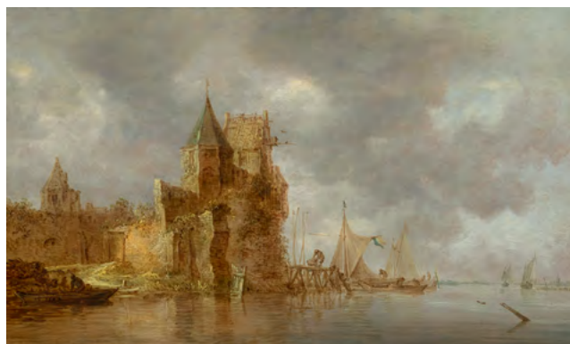
3024 JAN VAN GOYEN Flusslandschaft. 1642. Öl auf Holz. 33,5 × 55 cm. Verkauft für CHF 128 000