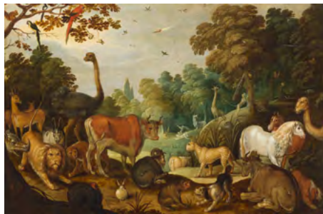
3016 JACOB SAVERY D. J. Adam und Eva in einer Paradieslandschaft. Öl auf Holz. 46 × 70,8 cm. Verkauft für CHF 61 000