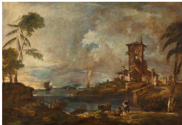
3067 FRANCESCO GUARDI Venezianisches Capriccio mit einem Turm, Hirten und Schafe. Öl auf Leinwand. 94,2 × 137 cm Verkauft für CHF 488 000

te mit CHF 128 000 (Los 3024) ihre untere Schätzung, und eine Winterszene mit Schlittschuhläufern von Barent Avercamp vervierfachte mit CHF 98 000 (Los 3037) fast ihre Schätzung.