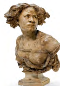
1199 JEAN-BAPTISTE CARPEAUX L'Afrique. Gips mit grau/bräunlicher Patina. H 68 cm. Verkauft für 253 000 Auktionsrekord

Hochauflösende Bilder hier verfügbar. Kataloge und Ergebnisse online: www.kollerauktionen.com (und klicken Sie auf die Bilder für den direkten Zugang zum Katalog)