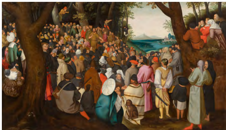
3015 PIETER BRUEGHEL D. J. Die Predigt des Heiligen Johannes des Täufer. Öl auf Leinwand. 95 × 162,5 cm. Verkauft für CHF 464 000