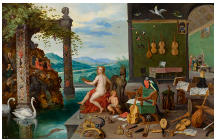
3022 JAN BRUEGHEL D. J. Allegorie des Gehörs. Öl auf Kupfer. 59,3 × 91 cm. Verkauft für CHF 244 000