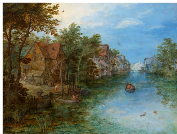
3019 JAN BRUEGHEL D. Ä. Dorfgracht mit Figuren, Booten und Anlegestelle. 1608. Öl auf Kupfer. 14,7 × 19,6 cm. Verkauft für CHF 85 000