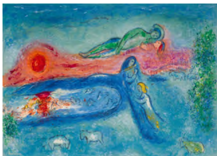
162 MARC CHAGALL Longus, Daphnis et Chloë. Mit 42 Original-Farblithographien von Marc Chagall Verkauft für CHF 104 000