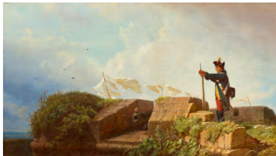
3210 CARL SPITZWEG Auf der Bastei (Militärposten im Frieden). 1856. Öl auf Leinwand. 22,8 × 40 cm. Verkauft für CHF 232 000