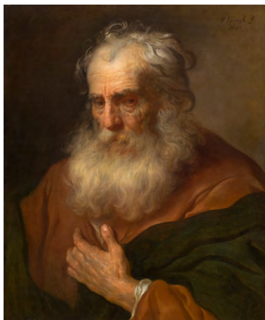
3025 GOVAERT FLINCK Tronie eines bärtigen Mannes. 1650. Öl auf Leinwand. 61,5 × 50,7 cm. Verkauft für CHF 833 000

Die Gipsbüste eines afrikanischen Sklaven von Jean-Baptiste Carpeaux (Los 1199) erzielte einen neuen Auktionsrekord von CHF 252 000 in der Auktion Möbel, Porzellan & Silber. Ein äusserst seltenes Dokument, das die Zwangsversteigerung der Kunstsammlung von Rembrandt van Rijn in der Auktion Bücher & Autographen ankündigt, wechselte für CHF 79 000 den Besitzer (Los 216), und ein Exemplar von Daphnis & Chloé von Longus mit Original-Lithographien von Marc Chagall (Los 162) wurde mit CHF 104 000 weit über dem oberen Schätzwert verkauft.