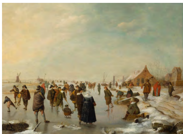
3037 BARENT AVERCAMP Winterlandschaft mit Eisläufern. Öl auf Leinwand. 44,5 × 60,5 cm. Verkauft für CHF 98 000